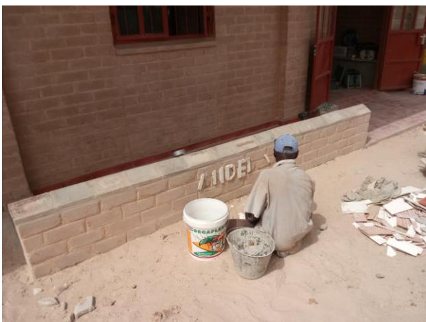
Het maken van "Sander's Clinic"