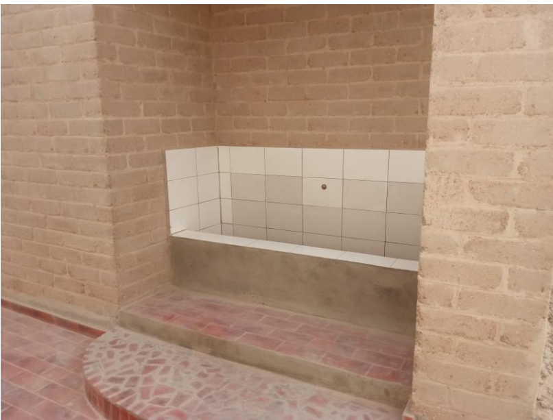
De betegelde "sluice" aan de zijkant van het gebouw