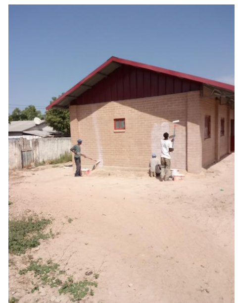
Aanbrengen van coating buiten