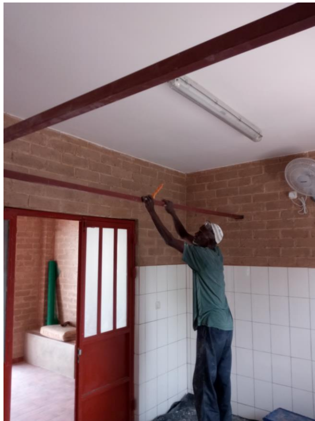
Constructie voor de gordijnen rond het bevallingsbed