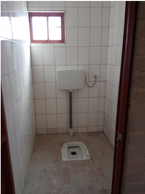
Hurk toilet bij de grote Ward