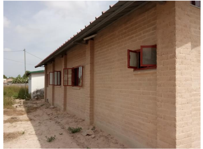
Metselwerk schoon gemaakt en klaar voor de water afstotende finishing