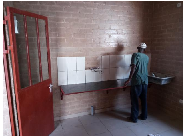
Het werkblad in de consultatie kamer