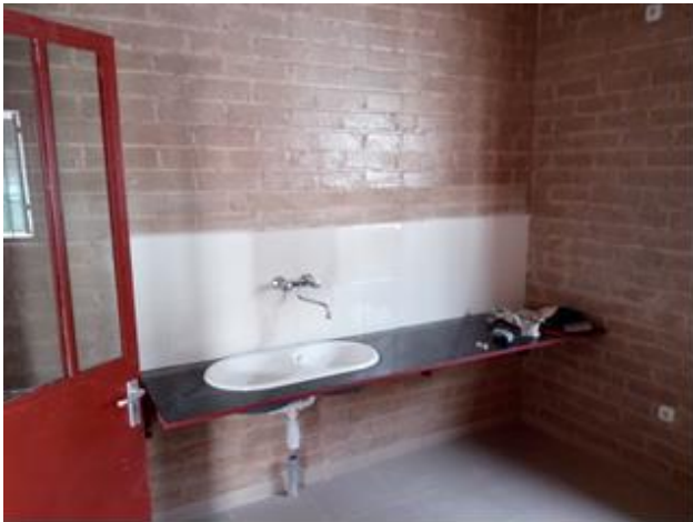
Werkblad met spoelbak erin