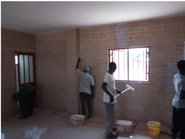
Muur coating wordt binnen aangebracht