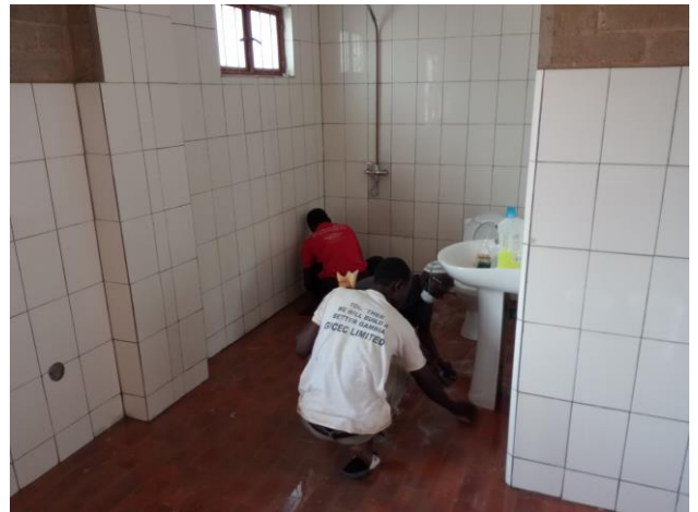
Schoonmaak van de ruimtes