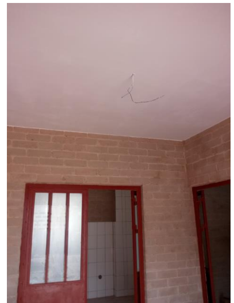
Plafonds gang zijn geschilderd