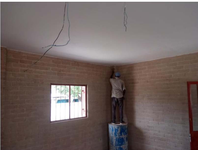
Schilderwerk in uitvoering