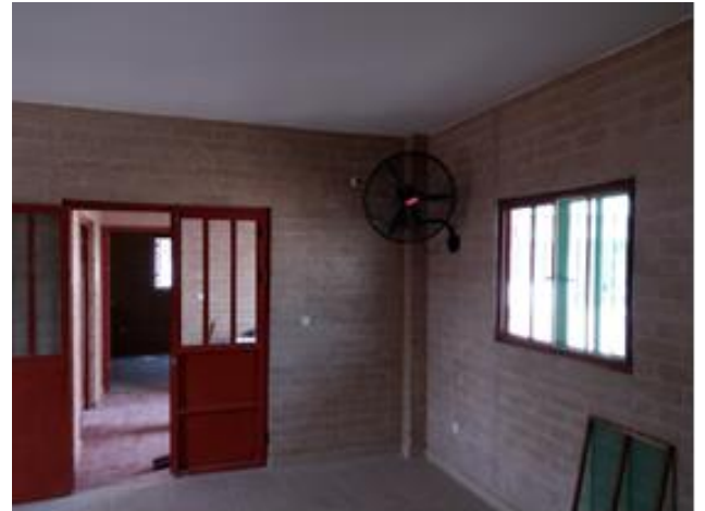
Verkoeling voor de grote Ward