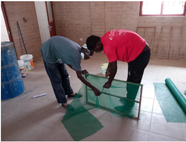
Het aanbrengen van gaas voor de horren