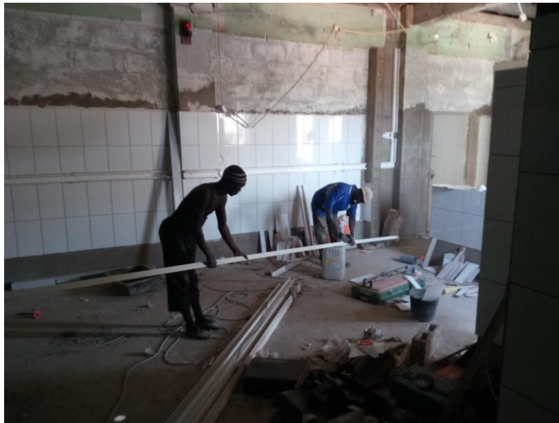
Hoeklijn wordt gezaagd waar straks de plafonds in liggen