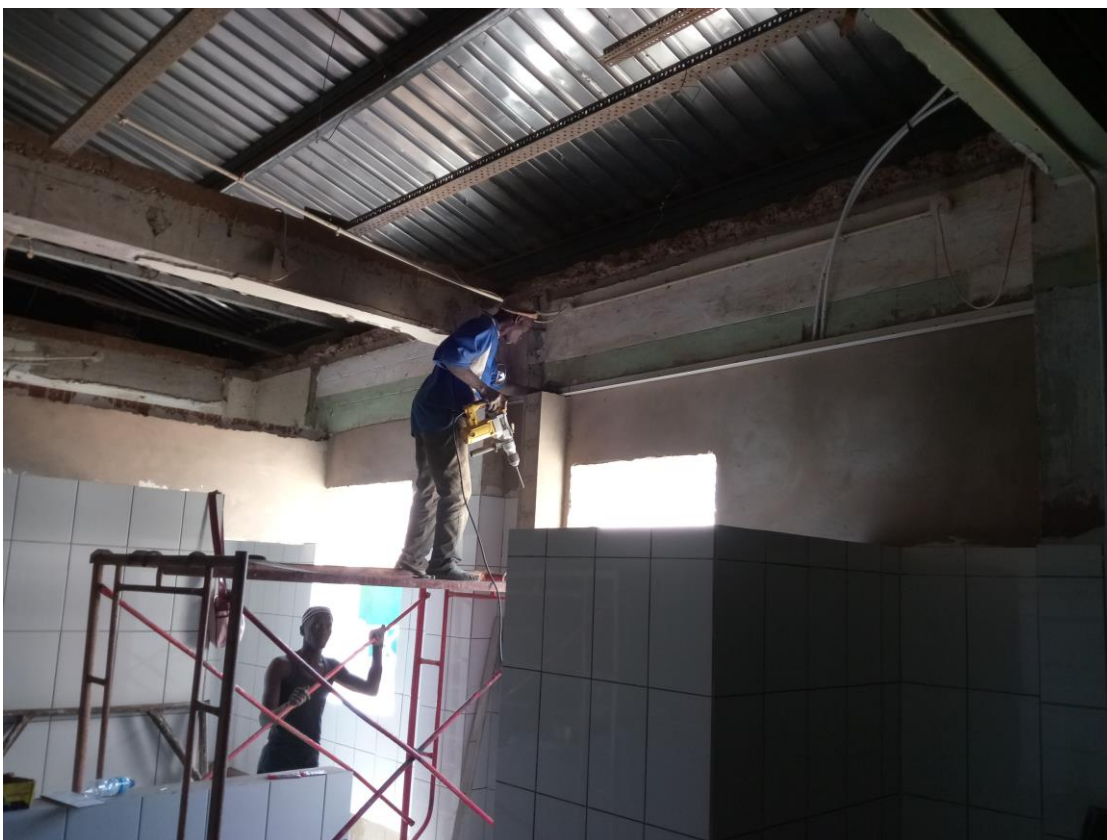
Aanbrengen van de hoeklijn voor de plafonds