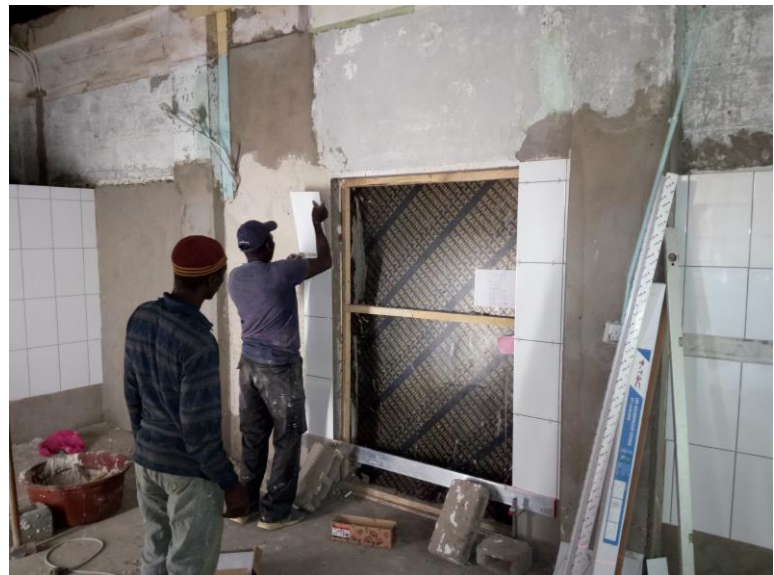
Met hulp van een rij (onderaan) waterpas werken