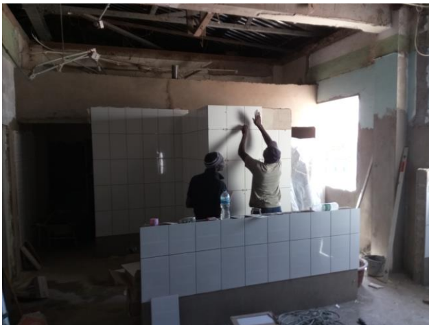
Tegels op wand van omkleedkamer