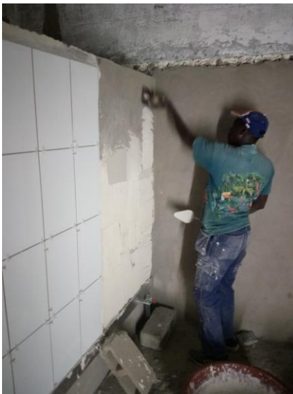
Werken met tegellijm