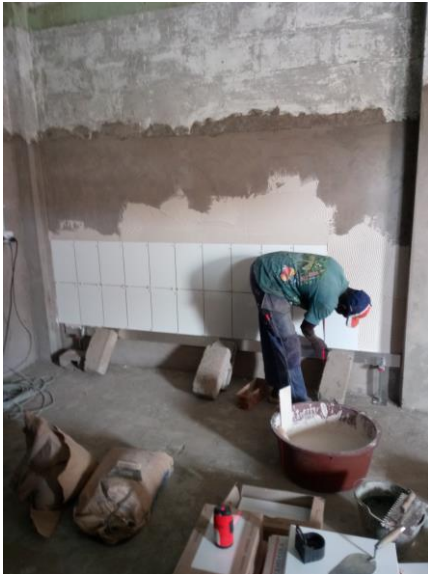
Eerste tegelwand wordt gezet