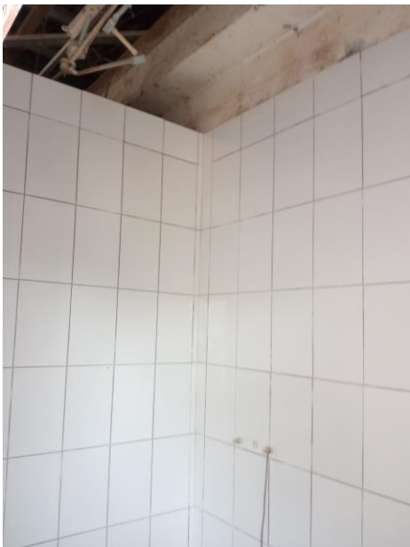
Badkamers tot bovenaan getegeld