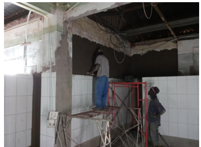
pleisterlaag om muur recht te maken