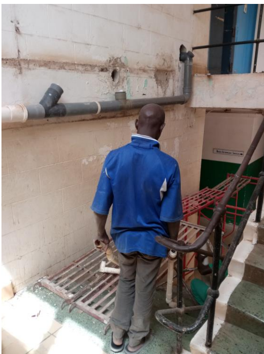
Nieuwe afvoer aansluiting