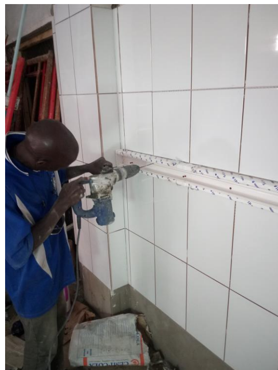
Aanbrengen van de elektra goten