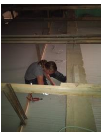
Elektra boven het plafond