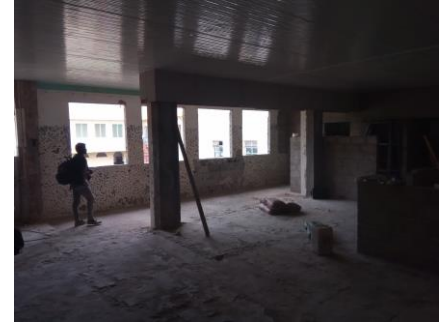
Plafond zit erin