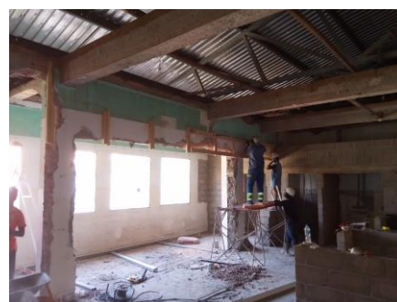
Muren observatie en sluis op hoogte