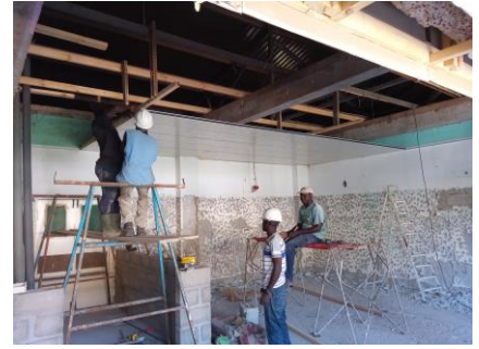
Monteren van de plafond platen