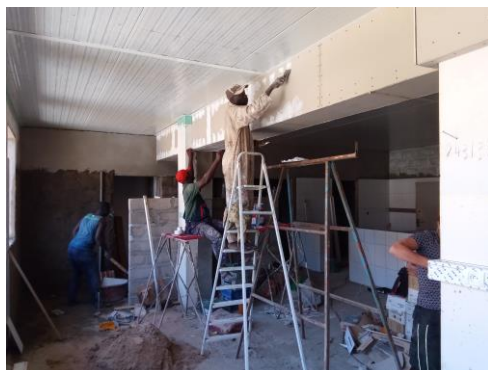
Schilders aan het werk