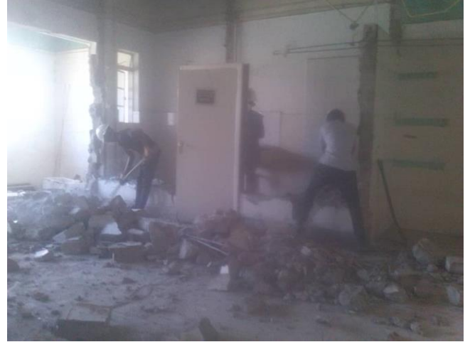
Sloopwerk van de muren die weg kunnen