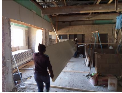
Plafondplaten naar boven brengen