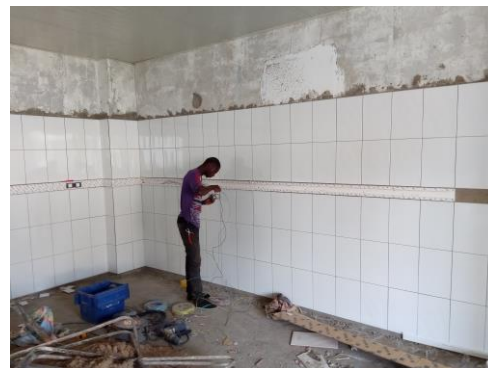
Montage elektra goten