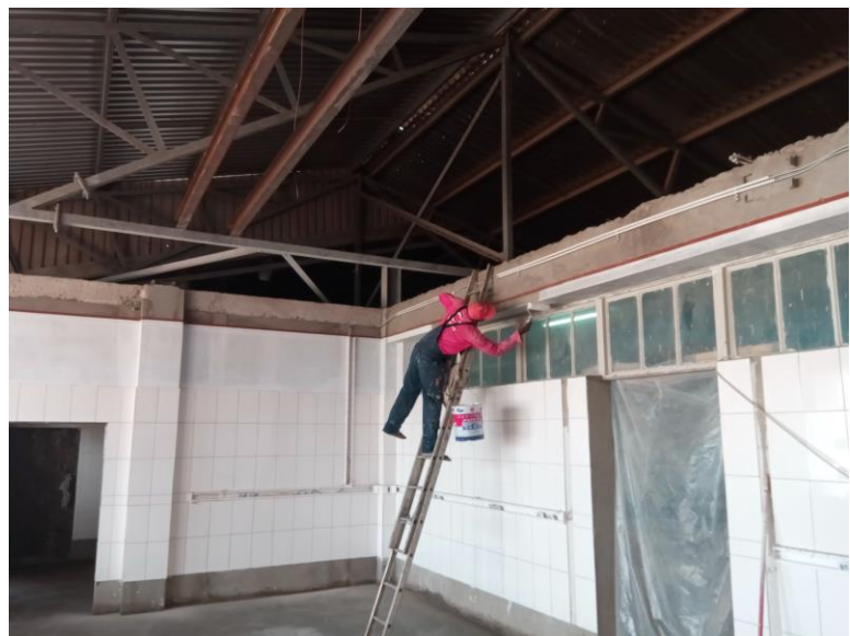
Gronden voor het vliesbehang