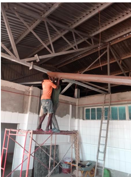
Plaatsen van stalen balk