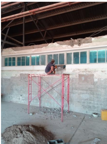
Doorgang van theatre's naar corridor