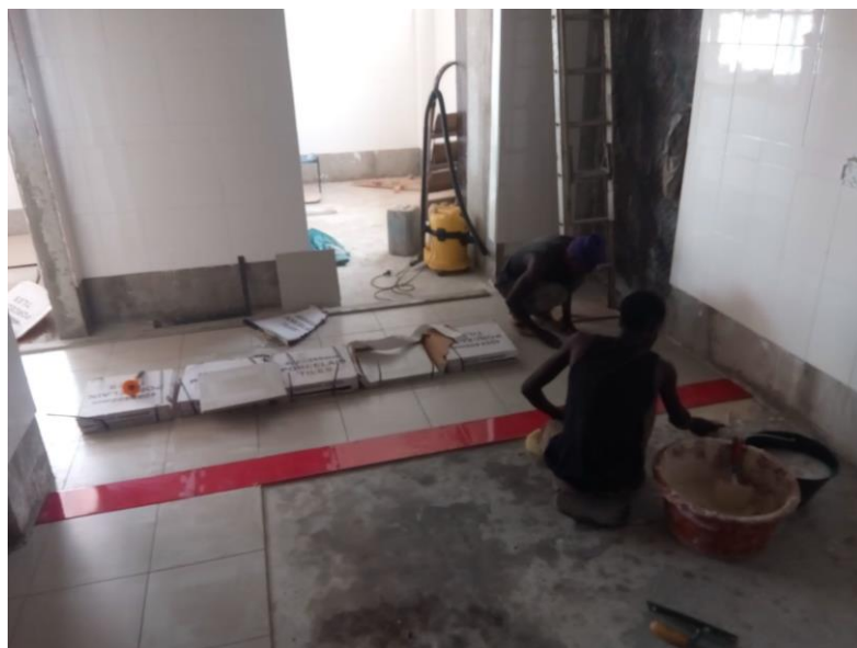
Rode lijn van tegels