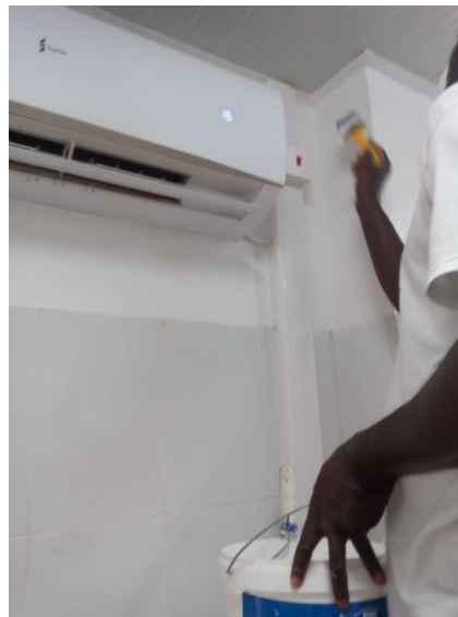
Herstel gat doorvoer airco small theatre (fase 3) buiten- en binnenzijde