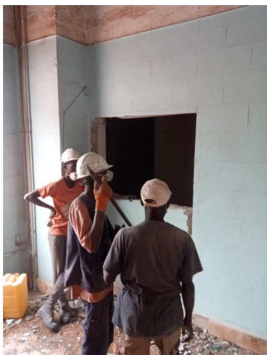
Doorgang van anaesthetic naar gang langs voorgevel