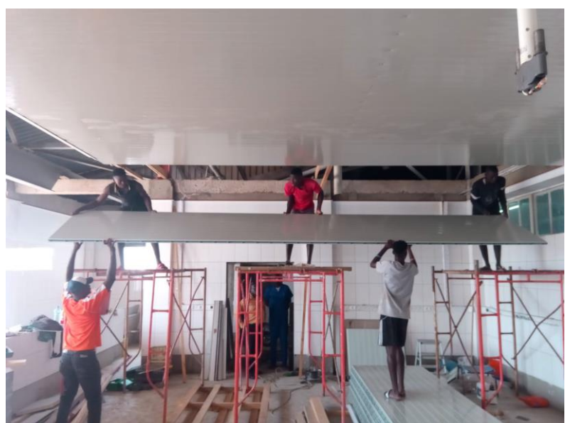
Aanbrengen van het plafond