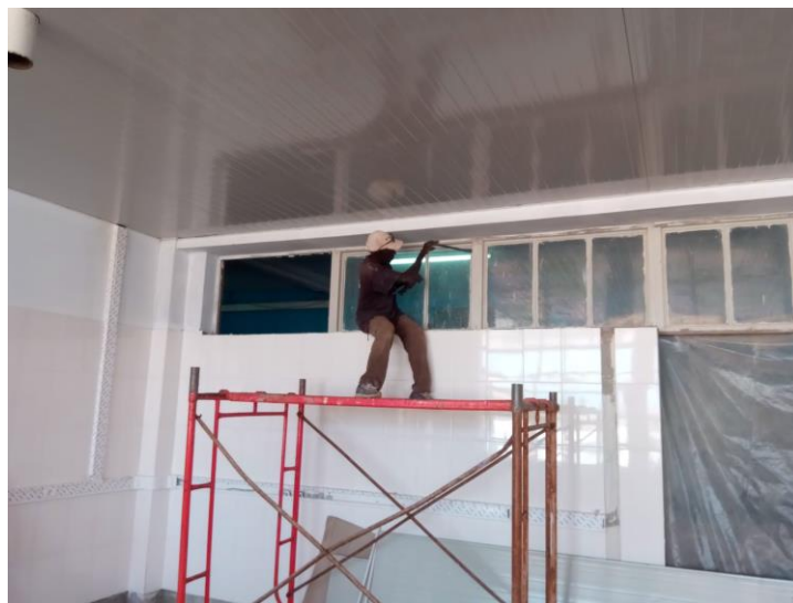
Verwijderen van hoge raamkozijnen tussen theatre's en corridor