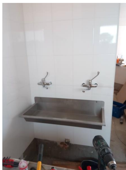
Scrub bij theatre 1