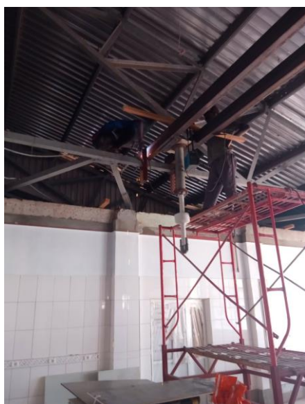
Ophangen operatielamp theatre 2