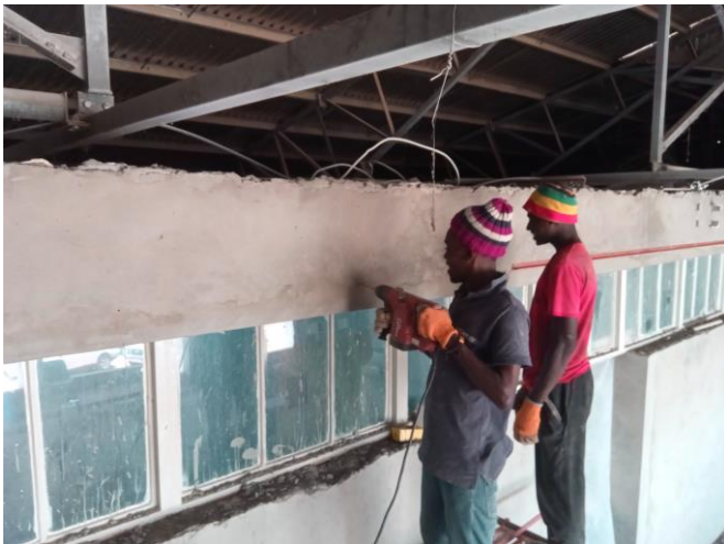
Monteren randprofielen plafond