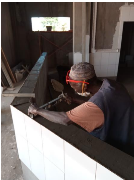
Waterpassen bovenkant borstwering