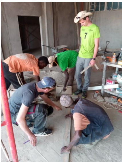
Uitzetten eerste blokken borstweringen