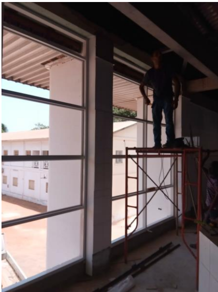
Monteren van de nieuwe voorgevelkozijnen