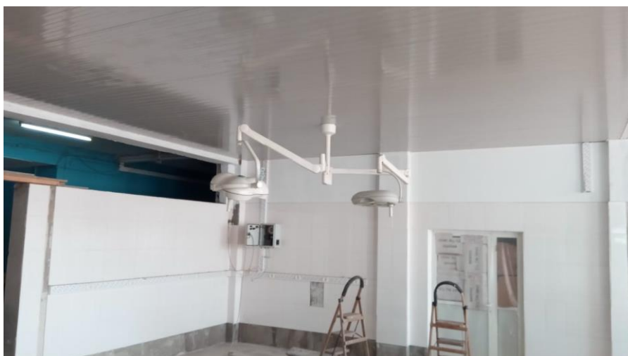
Operatielamp theatre 2 hangt