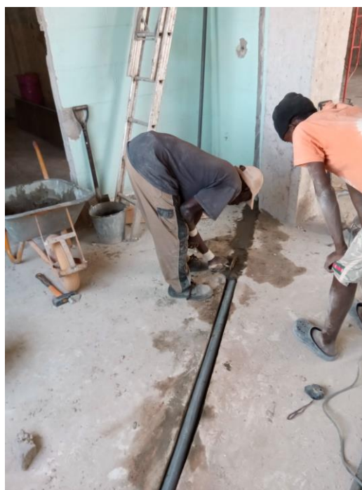
Afvoer voor scrub op nieuwe plek