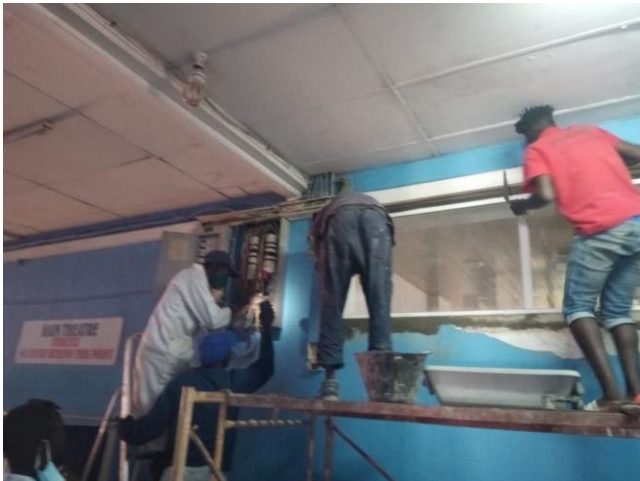
Aansluiten elektra op hoofdnet ziekenhuis