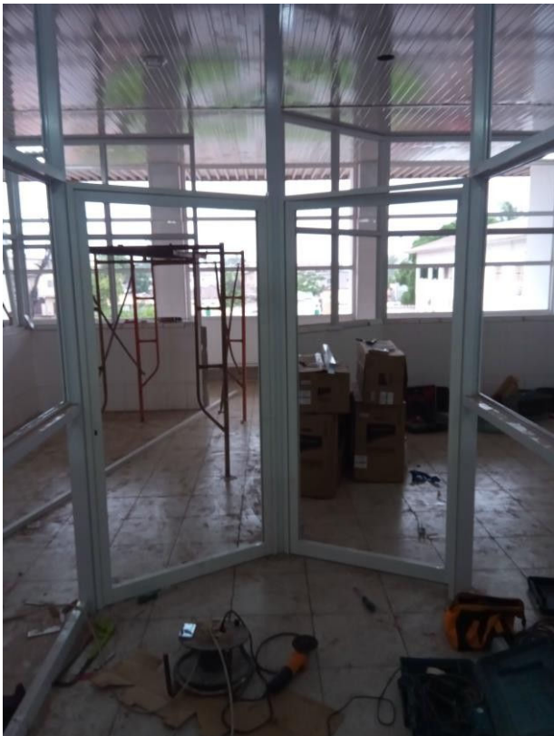
Deuren van de OK uitgangen