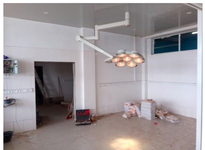
Operatielamp OK1 werkt