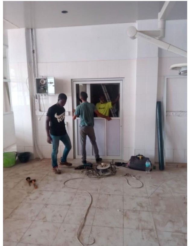
Afhangen van een toegangsdeur van OK1