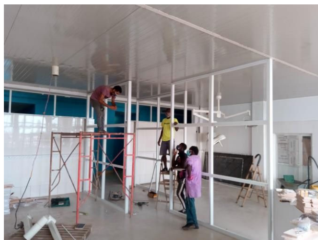
Nieuwe scheidingswanden van de kamers