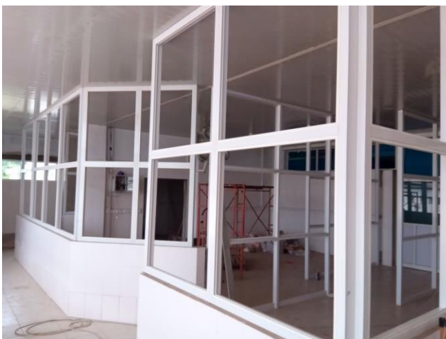
Nieuwe wanden op stenen scheidingsmuur