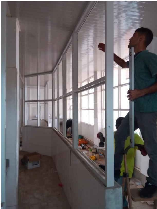
Stellen van de wand elementen