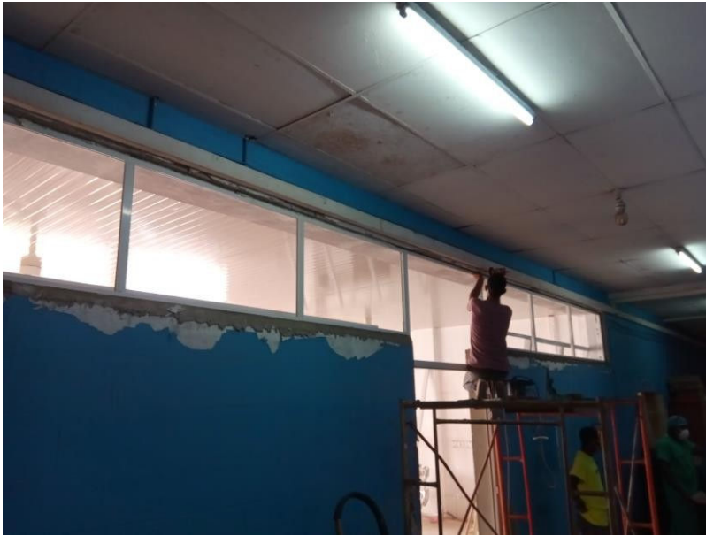
Plaatsen van de nieuwe kozijnen in de gang