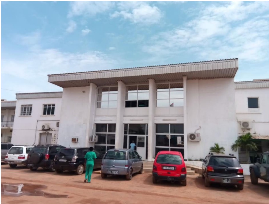
De ruiten zitten in de nieuwe voorgevel.