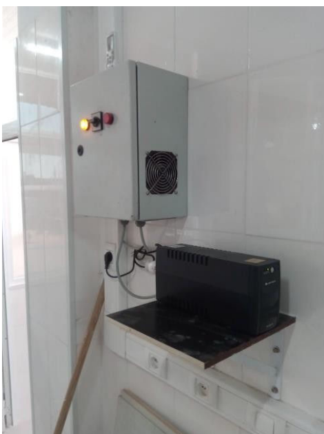
Back-up voor de elektra bij stroomuitval (UPS)