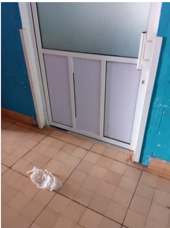
Versteviging gemaakt in toegangsdeur recovery