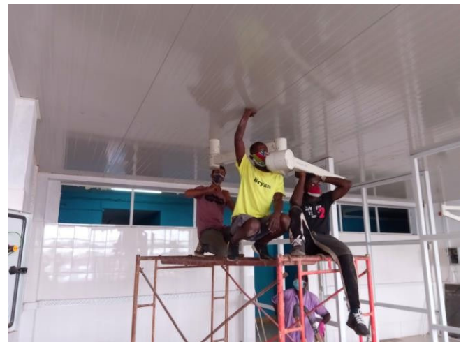
Ophangen van operatielamp OK 1