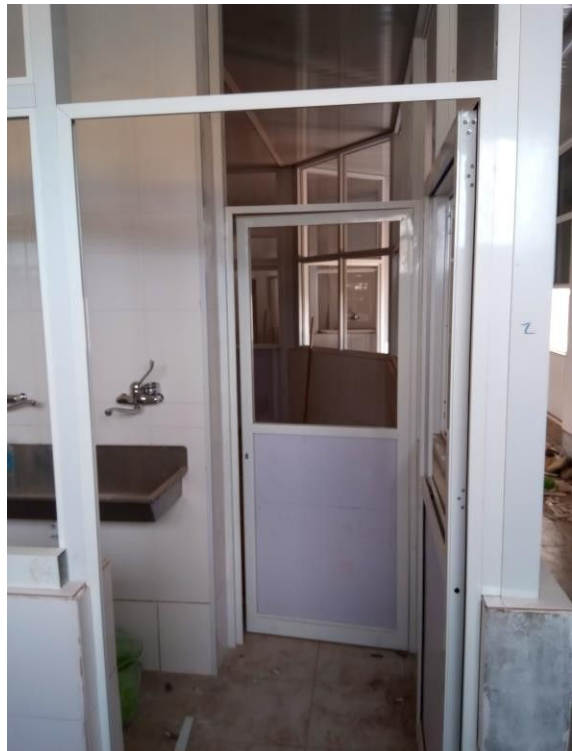
Deuren bij scrub OK1