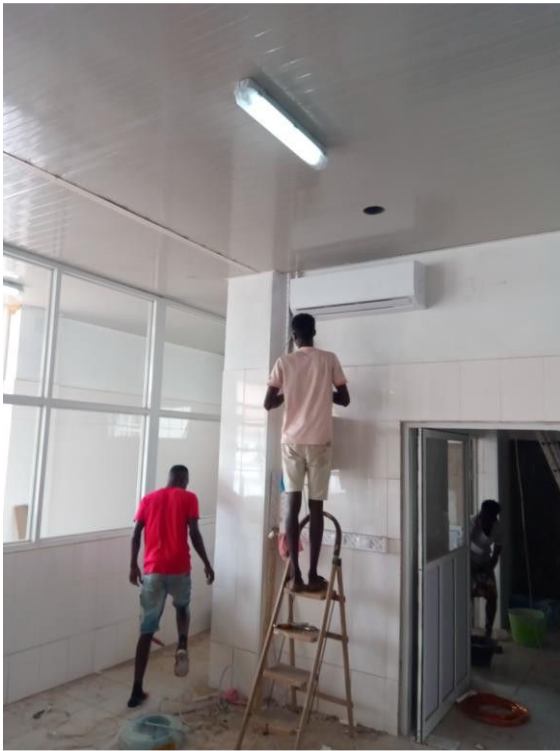
Montage van de nieuwe airco